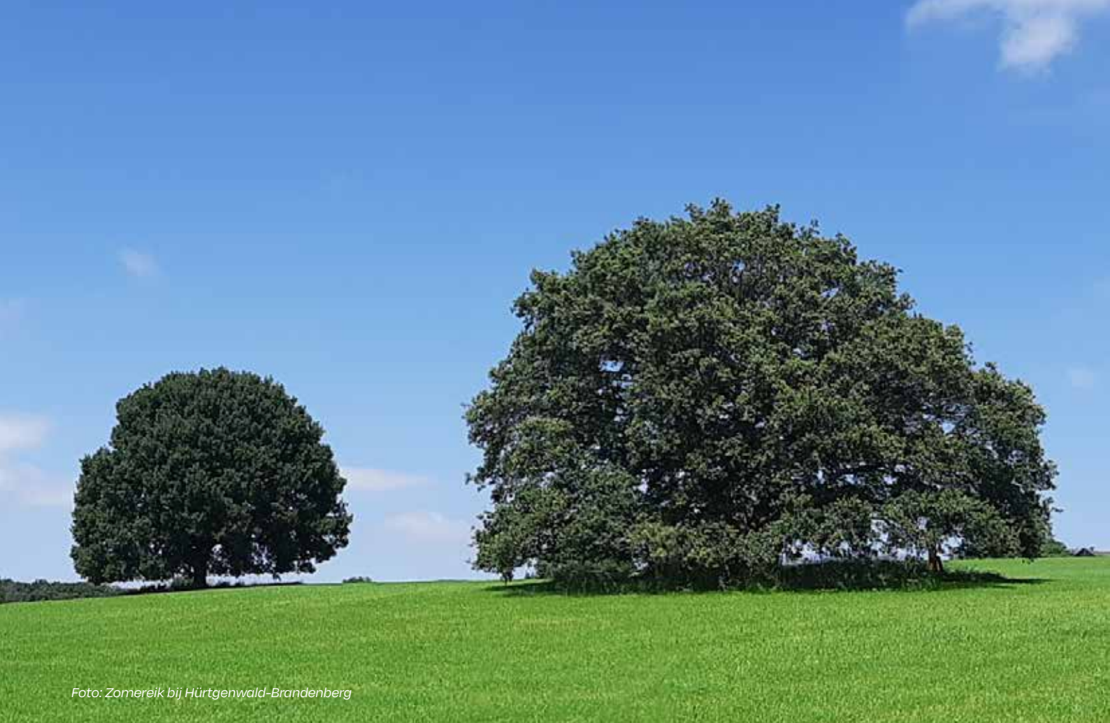
Foto: Zomereik bij Hürtgenwald-Brandenburg