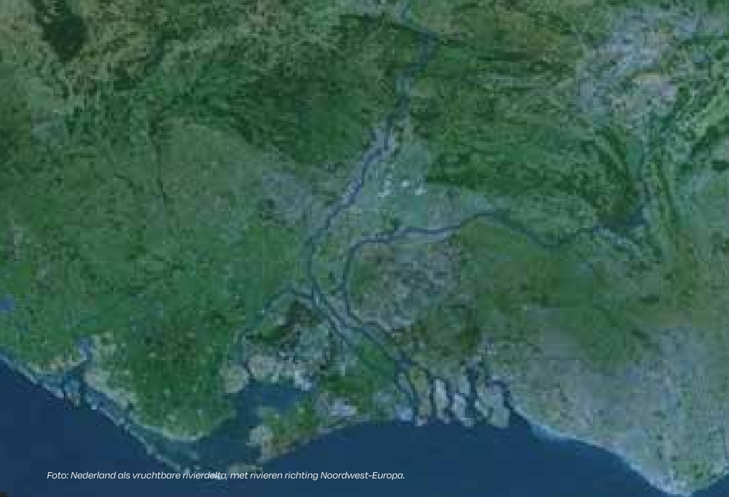
Foto: Nederland als vruchtbare rivierdelta, met rivieren richting Noordwest-Europa.