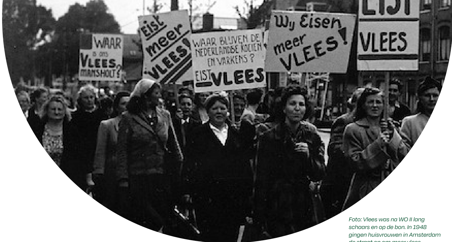
Foto: Vlees was na WO II lang schaars en op de bon. In 1948 gingen huisvrouwen in Amsterdam de straat op om meer vlees te eisen.