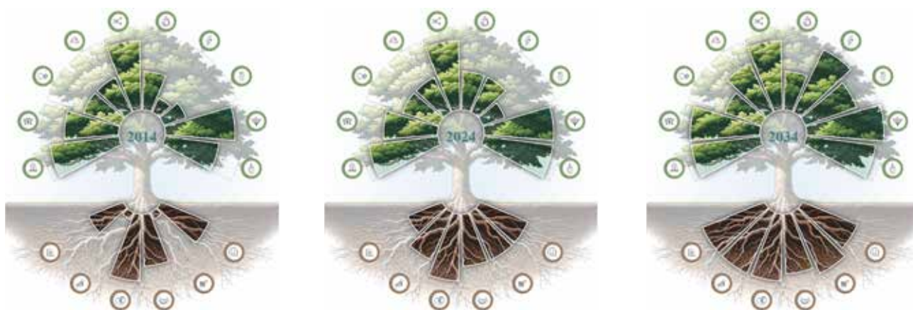
Figuur 1 BoerenBoom van een landbouwbedrijf, hoe is het nu (2024), waar komt men vandaan (2014) en waar wil men naar toe (2034).