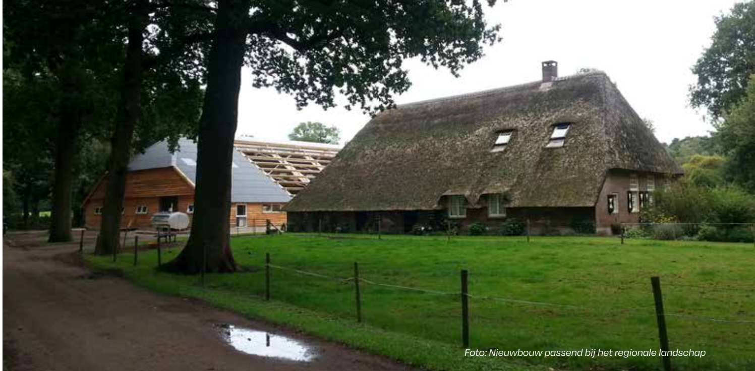
Foto: Nieuwbouw passend bij het regionale landschap