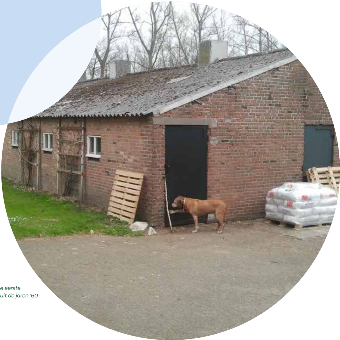
Foto: Een van de eerste varkensstallen uit de jaren '60