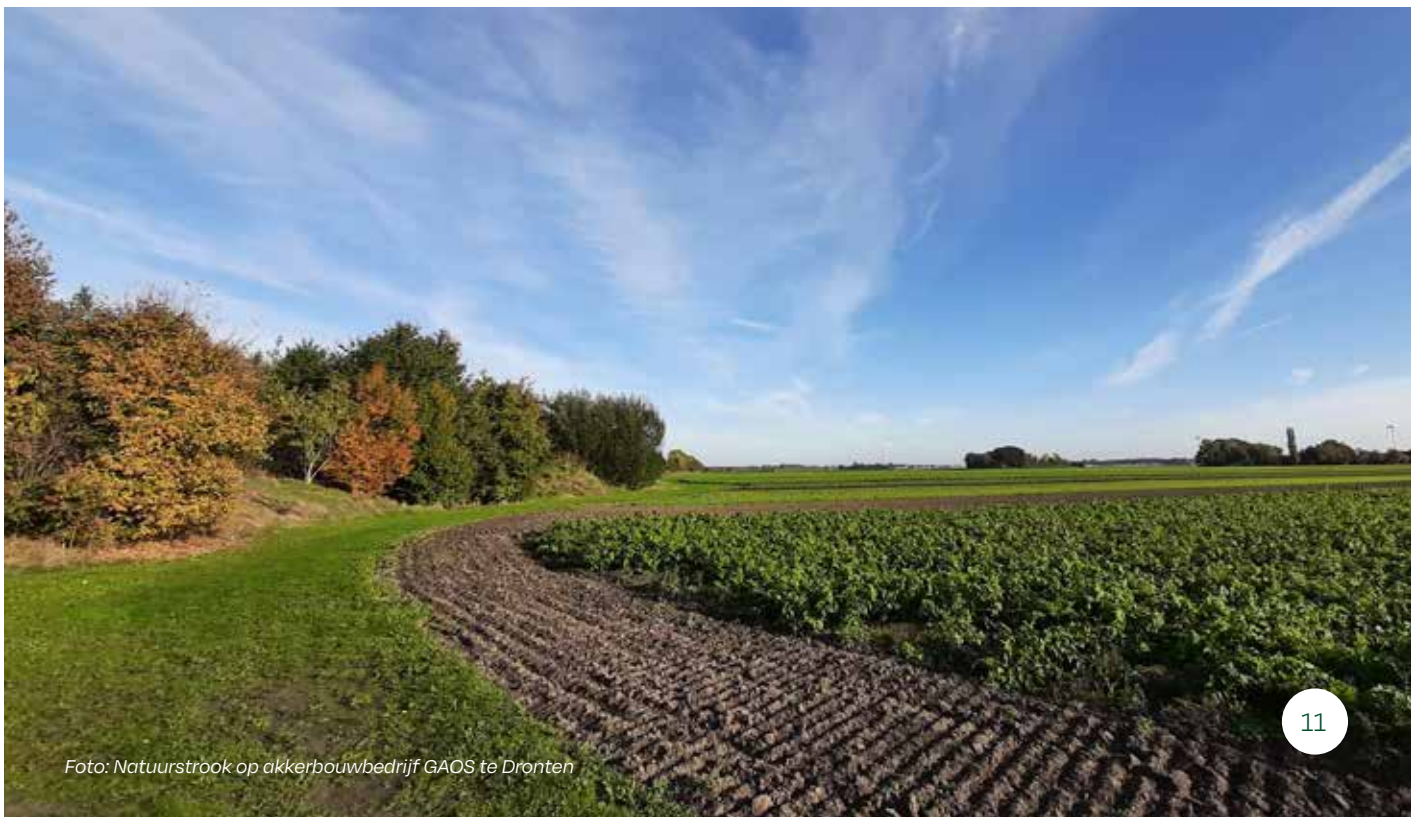
Foto: Natuurstrook op akkerbouwbedrijf GAOS te Dronten

Voor het beoordelen van het thema Bodem is het niet nodig om te beschikken over bodemanalyses of een profielkuil. Aanwezige metingen en gegevens helpen wel bij de observatie en duiding van de bijdrage aan het thema Bodem.