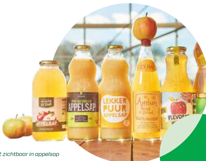
Foto: Boerendiversiteit zichtbaar in appelsap

De observatie met behulp van het instrument BoerenBoom laat je als ondernemer in de spiegel kijken: aan welke thema's levert het boerenbedrijf een grote bijdrage en aan welke thema's zou het boerenbedrijf meer kunnen bijdragen. Met kernzin, acties en ijkpunten kun je woorden geven aan waar je tevreden over bent en waar je graag verandering en ontwikkeling zou zien, en wat daarvoor nodig is. Hieronder volgen alle thema's met een onderbouwing en reflectie op nut en noodzaak van dit thema.